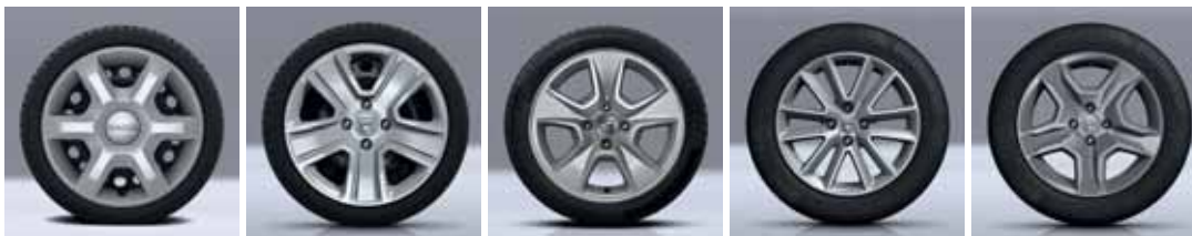
15" UKRASNI POKROV ARACAJU