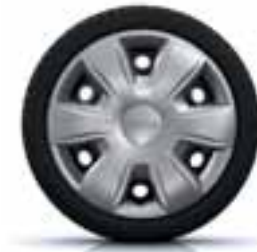
38 CM (15") OKRASNI POKROV TISA