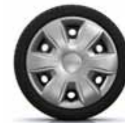
38 CM (15") OKRASNI POKROVI TISA*