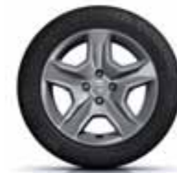
41 CM (16") PLATIŠČE BAYADÈRE DARK METAL**

(1) Enoslojna barva (2) Kovinska barva * Ni na voljo pri izvedenki Stepway. ** Na voljo samo pri izvedenki Stepway.