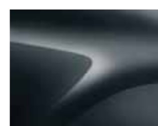
COMÈTE SIVA (KNA) (2)