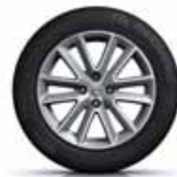
41 CM (16") LITO PLATIŠČE ALTICA*