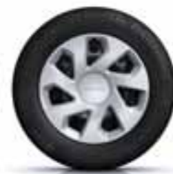
38 CM (15") OKRASNI POKROVI GROOMY*