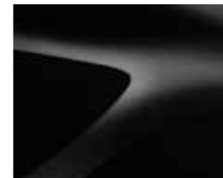
NACRÉ ČRNA (676) (2)