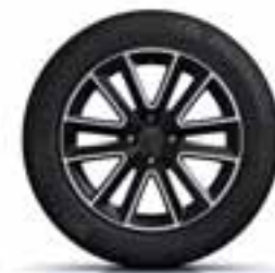
41 CM (16") LITO PLATIŠČE ALTICA Z DIAMANTNIM LESKOM ČRNA*