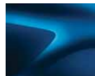
AZURITE MODRA (RPL) ***(2)