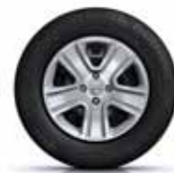
38 CM (15") OKRASNI POKROVI POPSTER*