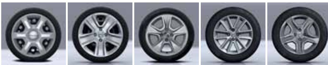
15" OKRASNI POKROV ARACAJU