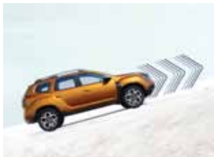
POMOČ PRI SPELJEVANJU V KLANEC

Tako pri vožnji po utrjenih kot tudi po neutrjenih poteh ima novi Dacia Duster vedno ustrezen rešitev: pomoč pri speljevanju navkreber za hitro in preprosto obvladovanje gorskih cest, sistem za nadzor hitrosti pri vožnji po klancu navzdol pa skrbi za enakomerno hitrost spuščanja. Ker pa pregled nad vsem včasih preprosto ni mogoč, vam kamera za prikaz različnih pogledov za lažjo vožnjo prikaže vse luknje, kamenje ali manjše ovire.