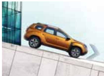
POMOČ PRI VOŽNJI PO KLANCU NAVZDOL