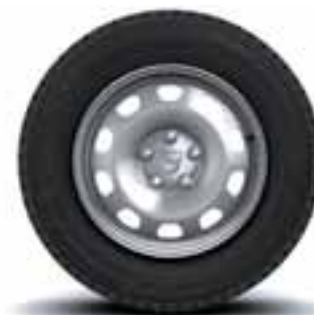
16" TÔLE PLATIŠČA