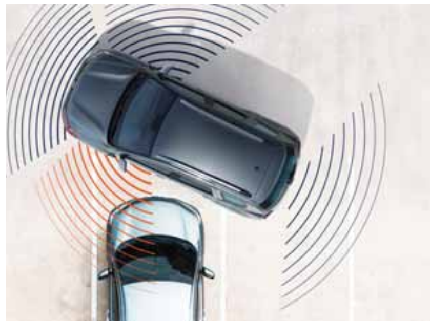
KAMERA ZA PRIKAZ RAZLIČNIH POGLEDOV