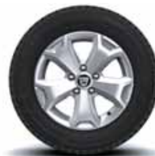
16" PLATIŠČA CYCLADE