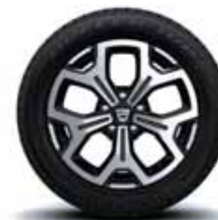
17" PLATIŠČA MALDIVES