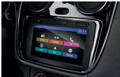
MEDIA NAV cu ecran tactil de 7"

Așa că, Lodgy îți propune, opțional, MEDIA NAV, un sistem multimedia intuitiv și ușor de utilizat, integrat în consola centrală, cu un ecran tactil de 7", care include radio, Bluetooth® și navigație. Cu sistemul multimedia ce echipează Lodgy poți să ascuți muzica preferată prin audiostreaming, dar ai la îndemână și folosirea telefonului mobil handsfree. Și pentru că trebuie să fii în locul potrivit, la momentul potrivit, te poți baza pe funcția de navigație, cu afișaj 2D sau 3D. În plus, ai satelit de comandă pe volan și prize Jack și USB.