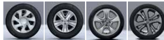
GROOMY 15" POPSTER 15" NEPTA 15" ALTICA 16"