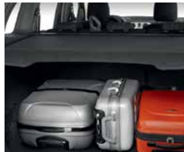
Tabletă portbagaj tip înfășurător