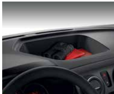
Spațiu de depozitare situat în partea superioară a planșei de bord