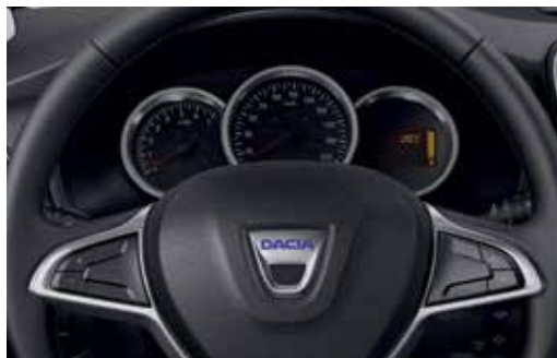
Volan Soft Feel cu 4 brațe