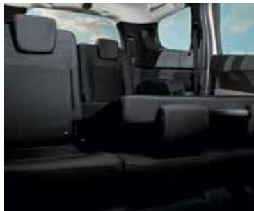
În funcție de versiune, bancheta de pe rândul al doilea este fracționabilă 1/3 - 2/3